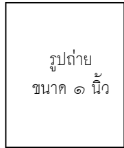
รูปถ่าย ขนาด ๑ นิ้ว